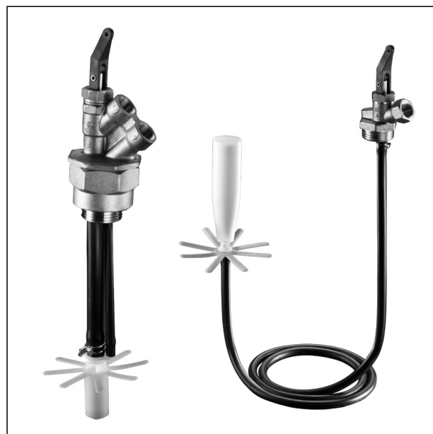
Beispiel: „Flexo-Bloc“ für Zweistrangsysteme (links) und „Flexo-Bloc“ für Einstrangsysteme mit schwimmender Absaugung (rechts)